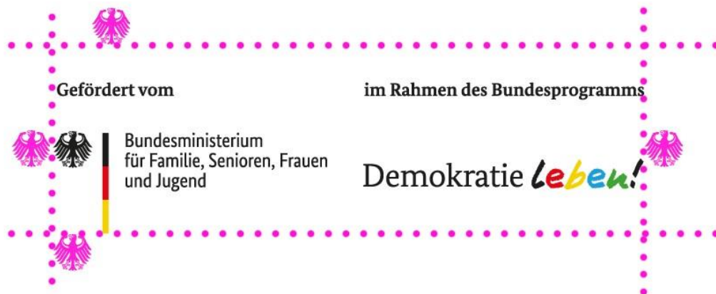
Illustration: Schutzraum um das Logo